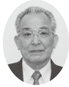
和木町社会福祉協議会