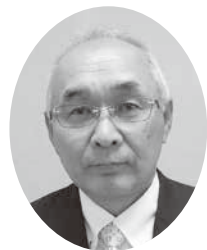
和木町民生委員児童委員協議会会長