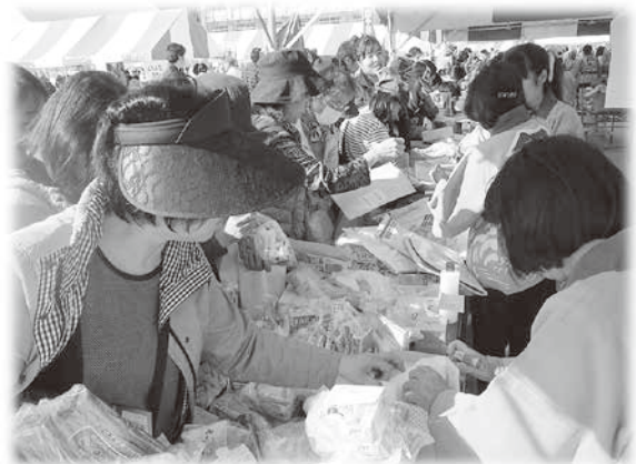
大盛況の福祉バザー

なお、バザー用品を快く提供してくださいました方々、ご購入してくださいました方々、そしてその収集、運搬にご尽力してくださいました方々に感謝いたします。