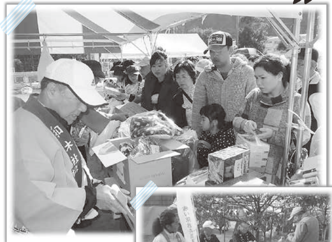
昨年のバザーの様子

また同会場において、クローバーの手づくりパンや赤い羽根共同募金の街頭募金も行っております。どうぞあたたかいご協力、よろしく願いたします。