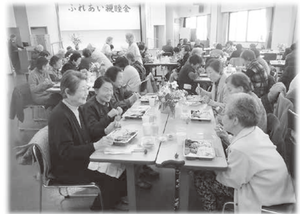
ふれあい親睦会の様子