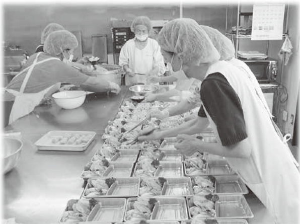
給食の調理の様子