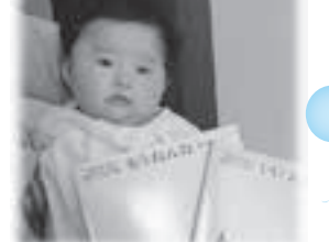
芹風(せりか)ちゃん