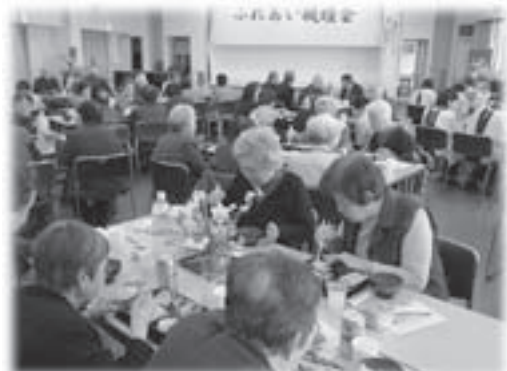
ふれあい親睦会の様子