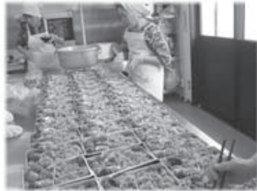
給食の調理の様子