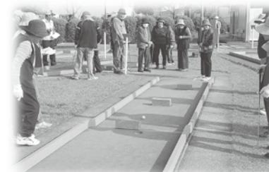
パットゴルフのようす

10月27日、蜂ヶ峯ゴルフガーデンパットゴルフ場で、ひとり暮らし高齢者(65歳以上)を対象とした、パットゴルフ大会が開催されました。毎年2回行われているこのパットゴルフ大会。楽しく体を動かせるということで、参加者の皆さんにも好評です。また仲間と親睦を深めながらプレーできることもあり、毎回大変な盛り上がりを見せています。この日もホールインワンありOBありと、みなさん夢中になってプレーし、我を忘れてスポーツの秋を肌で感じていたことでしょう。お疲れさまでした