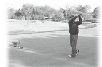
チャリティゴルフのひとつコマ

11月18日、晴天の下、和木ゴルフ倶楽部で赤い羽根共同募金チャリティゴルフ大会が開催されました。今回も、和木町体育協会ゴルフ部の皆さんの協力を得て、総勢26名の参加がありました。日ごろの練習の成果を発揮できた方、いつもの通りにはいかなかった方など、結果は様々。しかし、チャリティということもあって、みなさん終始笑顔でプレーしておられました。参加者の皆さん、本当にありがとうございました。なおベスト3は次のとおりです。