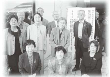
受賞者のみなさん