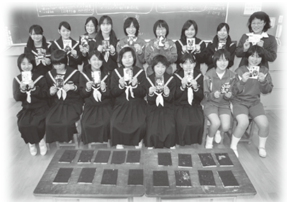
美術部のみなさん