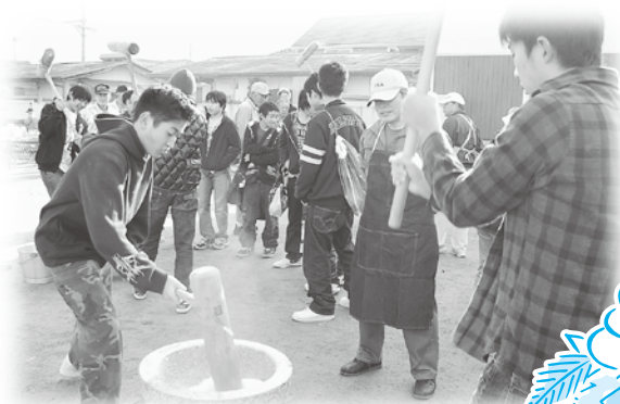
楽しそうにもちをつく生徒たち