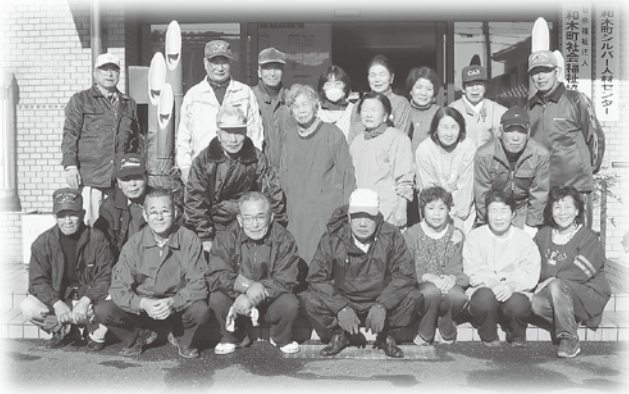
ボ連協のみなさん

日ごろからボランティア活動をされているだけあって、皆さん積極的にでききと、また丁寧に掃除されました。この福祉会館も皆さんの「ボランティア精神」を体全体で感じ、リフレッシュできたことでしょう。