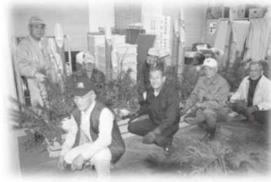
門松づくりのみなさん

12月11日、2009年への感謝の気持ちと、2010年も幸せな年でありませうようにとの願いを込めて、ボランティア連絡協議会の皆さんが、長年にわたり卓越された技術を駆使して、とても立派な門松を製作し、「社協」と「役場」、「わきあいあい苑」の三ヶ所それぞれに、飾り付けて下さいました。手づくりの門松を見るのが少なくなつた。今、和木町ではこうしてボランティア連絡協議会の皆さんが、古き良き時代の風潮を継承して下さいます。