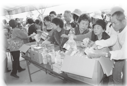
大盛況の福祉バザー