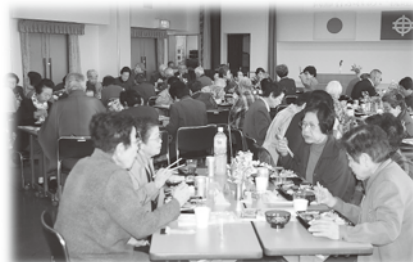
ふれあい親睦会の様子