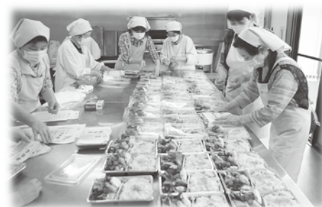
給食の調理の様子